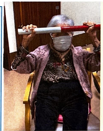
自宅でも出来る体操 〜棒体操〜