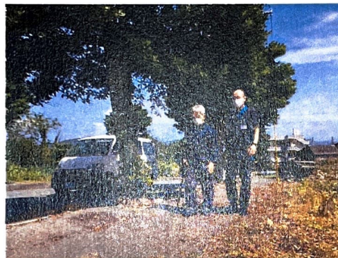
屋外歩行訓練 〜坂道偏〜