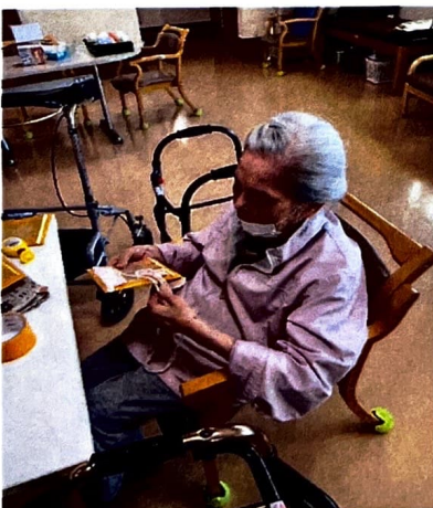
毛糸を織り込み、敷物づくり♪ 家族へプレゼントするそうです♡