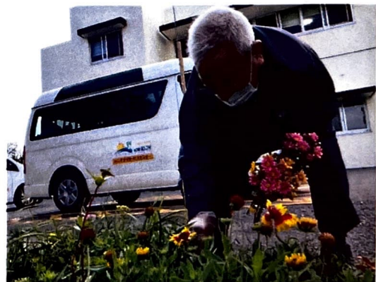
菊栽培の経験を活かして